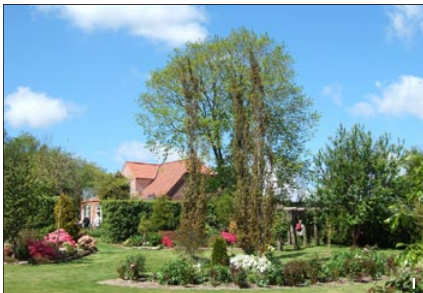
2. Rhododendron 'Elizabeth Lockhart'